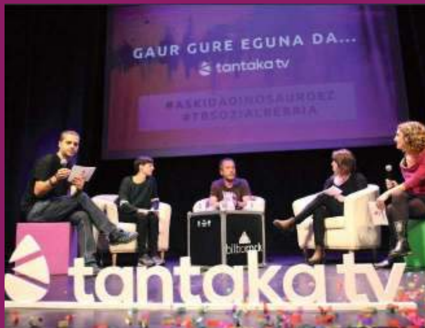
Tantakaren aurkezpen ekitaldia. 2018ko azaroa.

Azaroaren 15ean Tantaka mundura zabaldu genuen, Mugarik Gabe, Euskadi-Cuba eta Paz con Dignidad antolakundeek bultzatutako informazio alternatiboko proiektua, zeinak komunikazio tresna bat izan nahi duen Euskal Herriko eta munduko beste txokoetako kolektiboen eta jendarte mugimenduen aniztasuna, bai eta euren borrokak ere, ikusarazteko.