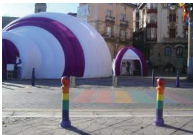
Memoria Eraikiz Portugaleten. 2018ko azaroa.

Erakusketa horrek bere bidea egiten jarraituko du, datozen urteetan, Euskal Herriko toki gehiagotan zehar.