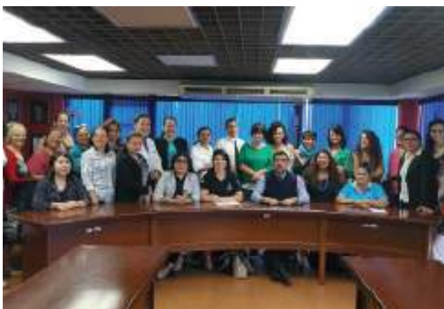
San Salvadorreko indarkeria egoeran dauden emakumeei arreta osoko eta prebentzioko erakunde eta sektore arteko Mahaian ordezkari izan zirenen parte hartzea. 2018ko iraila.

Urte honetako irailean, prozesu horri berari jarraipena emanda, esperientzien hartu-eman bat egin genuen El Salvadorren bertako La Colectiva Feminista eta Kolonbiako Corporación para la Vida Mujeres que Crean antolakunde aliatuekin batera. Gainera, Gasteizko arreta psikosozialeko eta indarkeria matxistako gaietan arreta legal eta juridikoko Arabako Emakumeen Asanbladako hainbat profesionalak esperientzia horretan parte hartu zuten. Jardunbide egokien eta eragina duten estrategien trukea, non emakumeen elkarteak eta antolakunde feministak, erakundeak eta gaian profesionalak diren pertsonak, emakumeentzako indarkeriarik gabeko jendarterantz gerturatzen jarraitzeko indartu ginen.