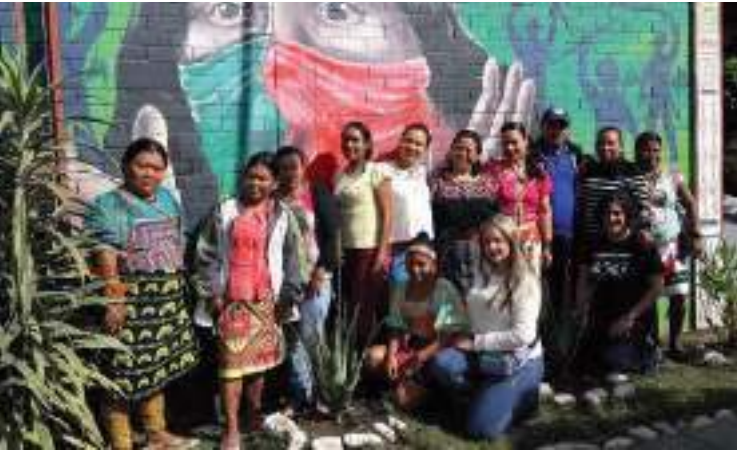
OIA eta CRIC antolakundeko emakume indigenen hartu-eman. 2018ko abuztua.

programarekin gure aliantza indartu genuen, Caucako Herri Indigenen Eskubideen eta bizitzaren defentsa eta babesa laguntzen jarraitzeko, guardia indigena, Giza Eskubideen behatokia eta eragin politikoa indartuta.