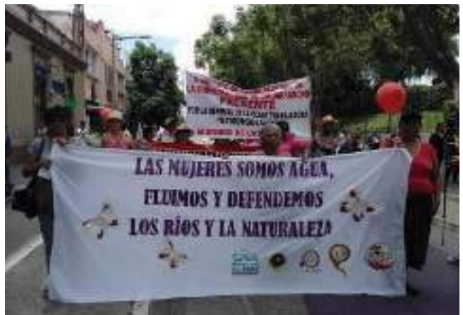
Uretatik martxa 2018ko maiatza.

Jarrera hegemonikoaren aurrean proposamen politiko emantzipatzailea egiten dute, Ongi Bizitzetik, pertsona guztientzat naturaren parte gisa, bizitzaren zaintzan erantzunkidetasuna bilatuta. Horrela, zaintzen aldeko Mahai nazionala eratu da, horren helburua da emakumeek zaintzari egindako ekarpen sozial eta ekonomikoa ikusaraztea eta erantzukizun sozialaren eta estatalaren inguruko proposamenetan jarrerak hartzea Giza Eskubideen testuinguruan. Hori formakuntza prozesuen, ekintza eta egituratze planen bitartez landu dute, proposamenak eta ekintzak egiteko aukera ematen dutenak.