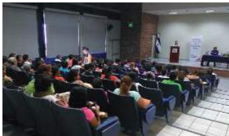
Indarkeriarik gabeko bizitza izateko eskubidea bermatzeko aurrerapen eta erronken jendaurreko foroa. 2018ko iraila.

2018 honetan zehar, Colectiva azken urteetan aurrera eramaten ari zen lanari jarraipena eman zaio, bai mendebaldean, bai eta erdigunean, San Salvadorko metropoli eremuan ere; udalean eragin politikoa izateko estrategia feministetan lan eginda eta herrialdeko mendebaldeko emakumeen antolakundeetako antolakuntza lanak indartuta, genero indarkeria, sexu abusua eta nerabeen haurdunaldiak gutxiagotzeko lanak berariaz lagunduta. Gainera, El Salvadorko eta Vitoria-Gasteizko feministen arteko lan eta esperientzien trukaketatik abiatuta legeria hobekuntzetan eta indarkeria matxistari eta sexu eta ugalketa eskubideei dagozkien lege aplikazioen hobekuntzan aurreratu da. Bereziki eragina izan du Kode Penalaren erreformaren onarpenean, abortuaren inguruko 133. artikuluan, antolakundeek ekitearekin eta eraginarekin eta erakunde publikoen eskumenetatik. Bost udalerritako emakumeen antolakundeek antolakuntza eta eragin gaitasuna indartu da, indarkeriarik gabeko bizitza izateko eskubidearen eta ugalketa eta sexu osasunerako eskubideen eraginkortasunerako. Eta Udal Gobernuen eta justizia langileen gaitasunak handitu dira genero indarkeriaren aurrean prebentziorako, babeserako eta sentsibilizaziorako.