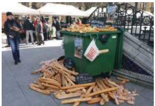
Kontsumitzaileen nazioarteko Egunean egindako salaketa ekintza. 2018ko martxoa.

Martxoaren 17an, Kontsumitzaileen Nazioarteko Egunarekin bat eginda, ogi xahuketa salatzen kale ekintza bat burutu genuen. Zehazki, galtzen uzten den ogi guztia edukiontzi batean eta ogi piloetan ikusarazi genuen, gaiaren inguruko informazioa eta aurreko egunetako ogiarekin egin daitezkeen errezetak banatu ziren, gainera, ogia olioarekin eman genuen. Beste alde batetik, aurten Sarearen webgunea berritzi da ( www.saretuz.eus ) eta Saretuz Mapari irizpide eta ko-