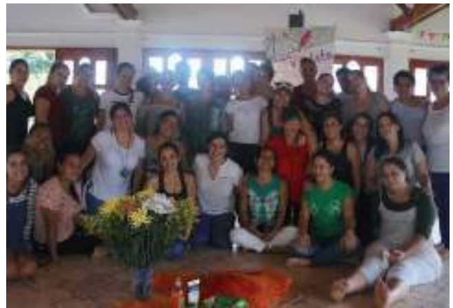
Escuela violeta para la construcción de la paz y equidad desde la niñez ekimenaren tailerra. 2018ko abuztua.

2018an, Kolonbian, gatazka armatuan indarkeriaren biktima izan eta bizirik atera diren emakumeentzako laguntzaren testuinguruan, azpimarratu behar da Colectiva Justicia Mujer eta Kanadako Abogados sin Fronteras taldearekin aliantzan aurrera eramandako auzi estrategikoaren eragina. Prozesu horretan hainbat estrategia garatu dira, hala nola, formakuntza, ikerketa, ekintza juridikoa eta komunikazioa. Bost kasu adierazgarriren bitartez, osasun fisikorako, mentalerako, sozialerako eta sexu osasunerako eskubidea itzultzea eskatu da aldeko epaiak lortuta. Gainera, Consejo de Seguridad Pública para las mujeres kontseiluan ikuspegi bereizgarria duen genero azpibatzerde bat sortzea ere lortu da. Gertakariak lurraldea gainditu eta naziora salto egin du, Unidad de Atención y Reparación Integral a Víctimas unitatera.