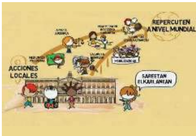
«Giza eskubideek ez dute mugarik» kanpainaren irudia.

Abenduan abiatu ostean, 2019an zehar arabar hiriburuari ekintzak egingo ditugu eta Kolonbiako Mujeres que Crean elkartearen parte hartzearekin kontaktuko dugu.