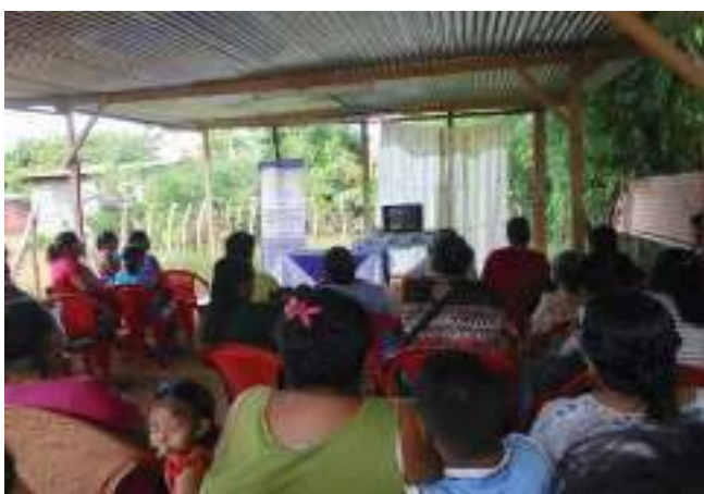
Emakumeen eskubideen inguruko zine eztabaida saioa. 2018ko martxoa.

Ekintzen momentuko geldialdi baten ostean, Ortega-ren aginduetara dauden armadaren, poliziaren eta pa-