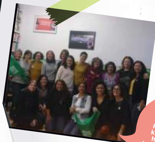
Mujeres que Crean eta Colectiva Feministako kideek parte hartu zuten batzarra. 2018ko azaroa.