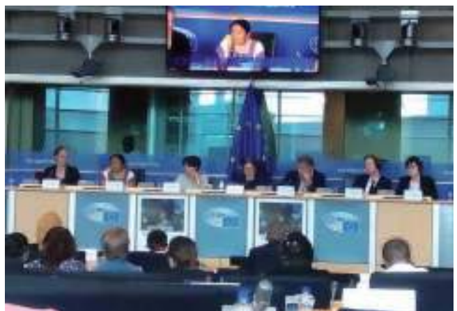
Europar Parlamentuan Giza Eskubideen Defendatzaileen kontrako kriminalizazioaren salaketa. 2018ko ekaina.

Era berean, eta Transnacionales, oligarquía y criminalización de la protesta social aurreko txostenaren babesarekin, giza eskubideen defendatzaileak laguntzen ibili gara Latinoamerikako herriek jasaten dituzten bortxaketan salaketan, batez ere oligarkia eta transnazionalen eskutik; salaketa hori ez dugu Euskal Herrian soilik zabaldu, Espainiar Estatuan eta Europan ere hedatu dugu.