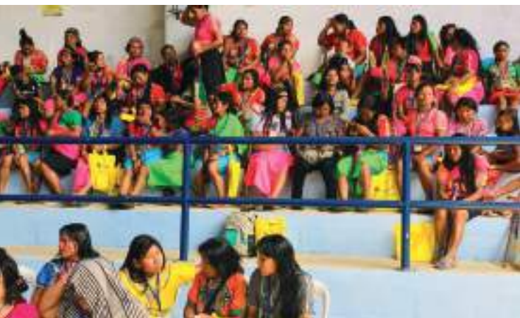
Antioquiako Emakume Indigenen Lehen Kongresua. 2018ko azaroa.

2018. urtea larrialdi egoera batekin hasi zen Bajo Cauca zonaldean, familia indigenen lekualdatzea eta konfinatzea ekarri zuen armatutako taldeen arteko enfrentamenduekin. Mugarik Gabek egoera hori lagundu dugu Arabako Larrialdietarako Funtsaren finantziazioarekin. Urtarrilean larrialdi horren testigu izan ginen, hain zuzen, Pertsona Defendatzaileen Babeserako Euskal Programaren barruan, Richar Sierra OIA antolakun-