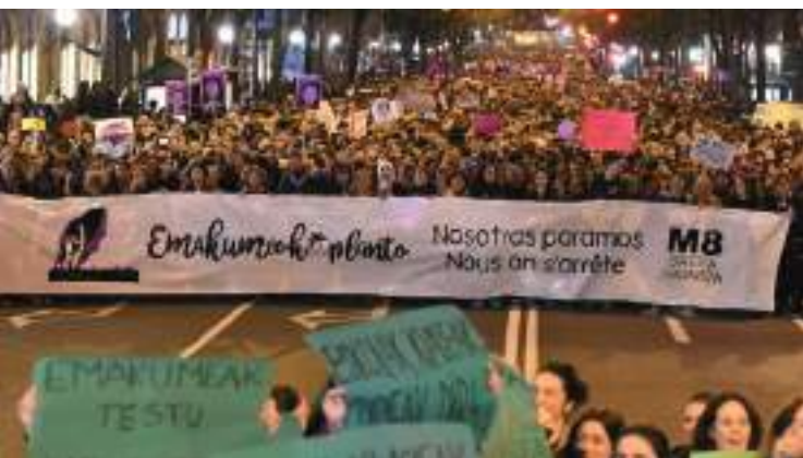
Martxoaren 8ko manifestazioa. 2018.

Euskal Herriko Emakumeen Mundu Martxan ere parte hartu genuen, 2018 honetan Martxaren Nazioarteko XI. Topaketa Bilbon ospatzeko aukera izan zen eta mundu osoko emakumeekin hartu-emanetarako eta ikaskuntzarako aprobetxatzeaz gain, hiritarrekin Feministon Herria partekatzeko ere aukera izan genuen, alternatiba feministaz jositako topaketa gunea.