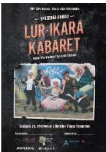
Amurrioko Antzerki Foroaren kartela. 2018ko ekaina

«Tipi-Tapa bagoaz! Bizimodu jasangarrietarantz» kanpainaren testuinguruan garatutako lanarekin jarraitu