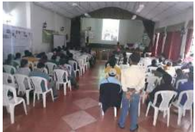
«Situación y amenazas por hidroeléctricas, palma de aceite, petróleo y caña de azúcar. Reivindicación de los pueblos indígenas en el territorio de Tezulutlan” Ikerketaren jendarteratzea. 2018ko urria.

Segurtasun neurriak ezinbesteko estrategia bihurtu dira komunitateen borrokan. Formakuntza prozesuen barruan, komunitate babeserako estrategiak identi-