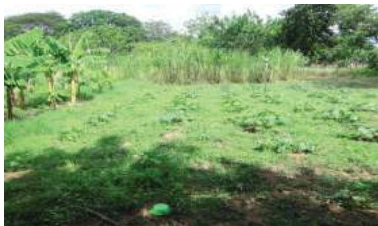
Dibertsifikatutako nekazaritza eremuak Malpaisillon. 2018ko martxoa.

Landa garapen bidezkoaren eta jasangarriaren sustapenean sakontzen jarraitu da. Horretarako, ikuspegi oso batetik antolakunde komunitarioen formakuntzan lan egiten jarraitu da, indarkeria matxistaren, berdintasunaren, sexu eta ugalketa eskubideen edota norbere