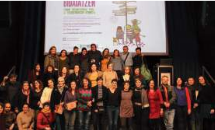
«Ikusezinean bidaiatzen: Eraldaketa feministarako antolakundeko aldateta» jardunaldiak. 2018ko abendua.

kunde aldatetik bidaiarako gomendioak eta txango moduan emandako zenbait erreminta, online eskura daude http://www.mugarikgabe.org/viajandoporloin-visible