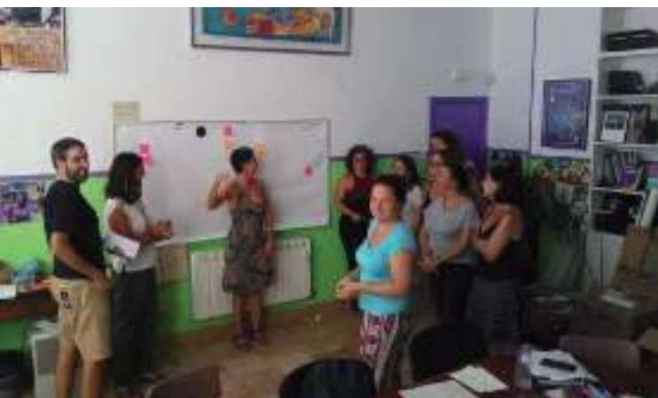
Mugarik Gabeko batzarra. 2018ko ekaina.

Mugarik Gaben genero ekitatearen aldeko antolakundeko aldateta prozesua bultzatzeko erronkarekin jarraitzen dugu, ezin zen bestela izan. Azken urte hauetan, Ikusezinean bidaitzen prozesuko parte hartzaileekin batera. Mugarik Gaben kasu zehatzean, aurten ikuspegi feminista batetik botereen azterketa indartzen jarraitu dugu, batzarraren espazioan zentratuta. Horretarako horien erraztea bultzatzen ari gara, rol hori agerikoago eginda eta beharrezko denborak emanda. Eta beste alde batetik, erabaki guneetan ere emozioak bistaratuta. Bidaia ez da laburra, ezta erraza ere, baina merezi duela argi izaten jarraitzen dugu.