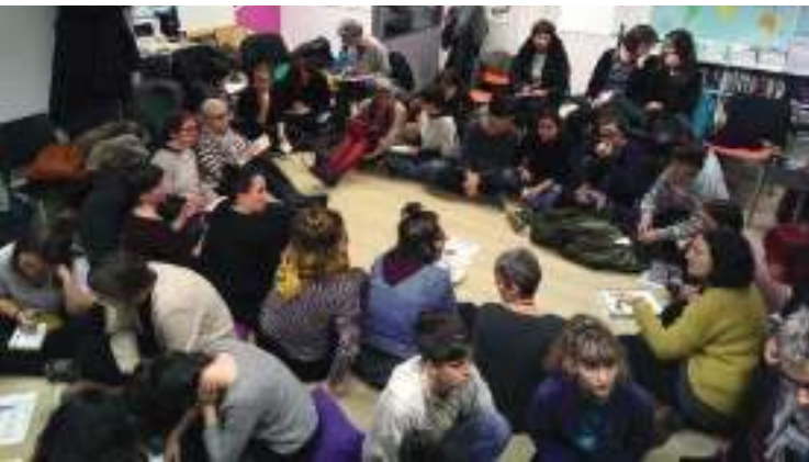
Donostiako Emakumeen Etxean mugimendu feministaren bilera. 2018ko otsaila.

Mugarik Gabek mugimendu feministarekin aliantza eta parte hartzea mantentzen du. Parte hartze hori, bereziki, Bilbo, Gasteiz eta Donostiako Koordinadora Feministetan egiten da. 2018 honetan martxoaren 8ko mobilizazio feminista historikoa, enplegu, lan eta zaintza grebaren bitartez egindakoa, bere indarragatik, aniztasunagatik eta izaera jendetsuagatik azpimarratu nahi dugu.