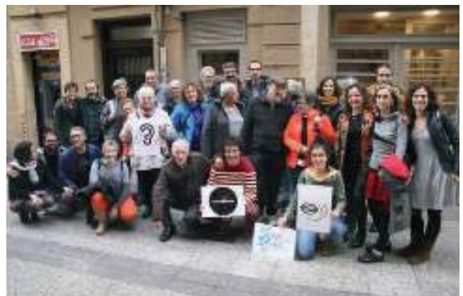
Gipuzkoako herrialdean GGKEko Koordinadoraren bazkaria. 2018ko azaroa.

Irailaren 27an urteurren gala egin zen, bertan hausnarketarako, emoziorako, barrerako eta aldarrikapenerako momentuak nahastu ziren. Azken finean, atzera begiratu eta lortutakoari balioa emateko, eta horrela, lankidetzaren arloan momentu honetatik bertatik ditugun errokei eta desafio globalei ilusioz aurre egiteko.