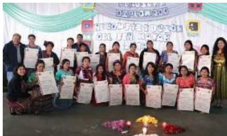
“Reconstrucción del Ser Mayab” Diplomatuaren itxiera. 2018ko abuztua.