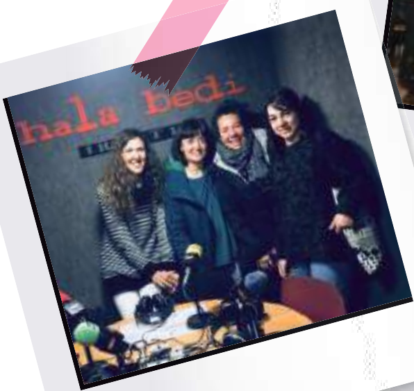
Mugarik Gabe Hala Bedi Irratian. 2018ko otsaila.