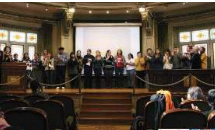
Bizimodu Jasangarrirako Eskubidearen aldeko Herri Auzitegiaren itxiera. 2018ko otsaila.

Auzitegiak salaketa elementu gisa balio izan duela espero dugu, bizitzaren alde munduko hainbat txokotan aurrera eraman diren erresistentzia prozesu eta protesta sozialen arteko elkartasun adierazpena, eta giza eskubide horien urraketak jasan izan dituzten pertsonenganako erreparazio sinbolikoa izatea.