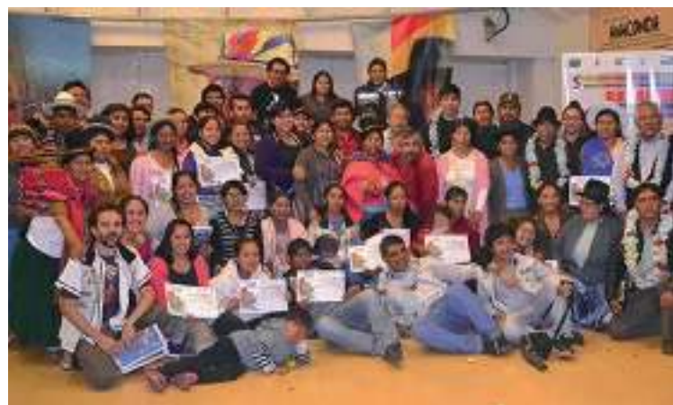
“Retos y Desafíos en la construcción de estados plurinacionales: derechos, comunicación y descolonización hacia el vivir bien” 5. Nazioarteko Topaketak. 2018ko maiatza

Azkenik, Coordinadora Latinoamericana de Cine y Comunicación de los Pueblos Indígenas (CLACPI) koordinadoraren parte denez, CEFREC zentroak urte honetan zehar hainbat jaialdi eta nazioarteko zinema emanalditan parte hartu du, hala nola, 2018an Guatemalan ospatu zen 13 o Festival Internacional de Cine y Comunicación de los Pueblos Indígenas / Originarios - FICMAYAB' jaialdiaren 13. edizioan edo Paraguain egin zen Premio Anaconda sariaren antolakuntzan. Ekitaldi horiek kontinente osoan herri indigenen ikus-entzuzko ekoizpenen erakustaldia eta balio ematea egingo dute, eta horien bitartez euren herrien errealitate eta borrokak ezagutarazten dituzte.