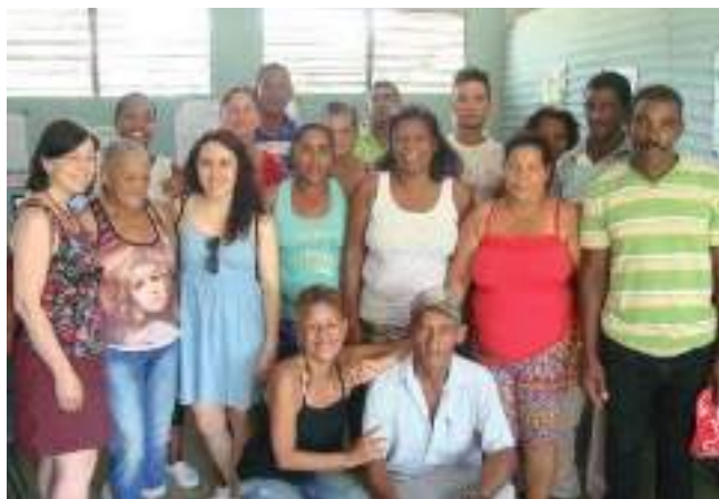
Santiagoko Salvador Rosales UBPC kooperatiban bilera. 2018ko uztaia.

Laguntza, batetik, formakuntzazkoa eta teknikoa da, eta bestetik, teknologikoa, azpiegiturak berrituta, ureztatze sistemak, jezte sistemak eta bestelako hornidurak ezarrita. Era berean, existitzen diren genero ez-