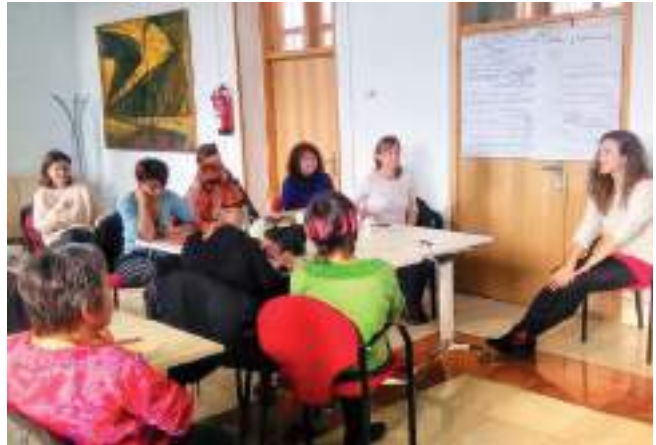
"Zeinek zaintzen du eta nola Vitoria-Gasteizen?" ikerketaren aurkezpena Vitoria-Gasteizko Emakumeen Berdintasunerako eta Ahaldunderako Eskolan. 2018ko urtarrila.

APP bat egin ziren, bai eta zenbait iritzi artikulua ere. Hori guztia www.consumoresponsable.info/eu/hasiera/ helbidean eskura dago.