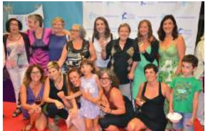
Euskadiko GGKEen Koordinadoraren Urteurren Gala. 2018ko urria

2018an Euskadiko GGKEen Koordinadorak 30 urte bete zituen, lankidetzako euskal politikek bezala. Orain dela hiru hamarkada, jendarte bezala konpromisoa geure gain hartu genuen eta gure mugetatik kanpo gertatzen zenari arreta jarri behar geniola erabaki genuen. Hainbat izan dira urte honetan zehar bultzatu diren ekintzak, esaterako, 30 urte azterna uzten ikus-entzunezko kanpaina, horren bitartez GGKEek euskal hiritarren, erakunde publikoen eta antolakundeen beraien elkartasun ahaleginari esker aurrera eramaten dituzten proiektu batzuk azaltzen dira. Horietako batean CEFREC izan zen protagonista, Boliviako gure kidea.