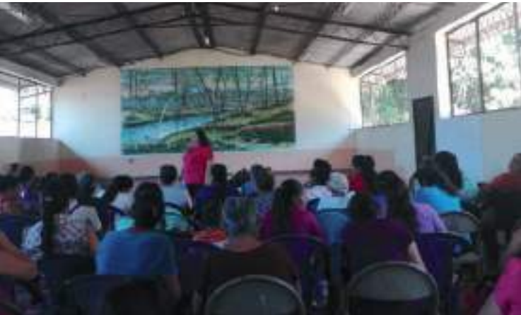
Komunitateetako emakumeei ikuskaritza sozialean formakuntza emateko prozesua.

proposamenetan ere. Bere misioa proposamen filosofiko, ideologiko, etiko eta kritikoa bultzatzea da, bertatik arau patriarkal, kapitalista eta heterosexista errotik kentzeko. Eraldaketa sozial, politiko kultural, ingurugiroko eta ekonomikoen bitartez, emakumeen menpeze eta zapalketa ezabatu, eta sexu eta ugalketa eskubideen errespetua eta gozatzea bermatuko dutenak. Hori lortzeko estrategia nagusiak hauek dira: Emakume taldeen antolaketa, ahalduntze indibidual eta kolektiboa sortuta, Estatuko erakundearen aurrean euren salaketen protagonista izan daitezen. Tokiko gaitasunen indartzerako formakuntza. Eragina, presioa, mobilizazio politikoa eta ikuskaritza herritarra baita lkerketa ere, emakumeen eta feministen mugimendua eraldatu eta lagundu nahi dugun emakumeen errealitate zehatzaren inguruko jakintzetan sakontzeko eta eguneratzeko, behar bezala oinarritutako proposamenekin.